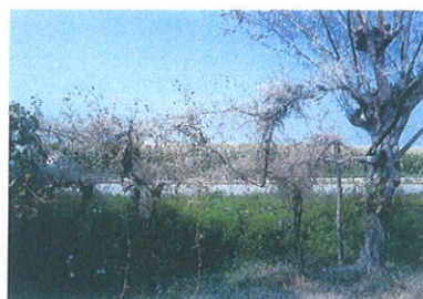
Esiti di una grave infestazione di Ilfantria su filare di vite

Ditteri Tachinidi: Nemoraea pellucida Meig. Compsillura concinnata Meig.