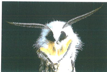
Particolare del capo di adulto