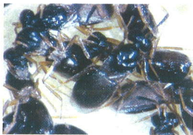
Adulti di Tetrastichomia clisiocampae sfarfallati da un'unica crisalide di Ilfantria