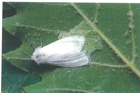
Femmina nell'atto di ovideporre