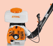
Atomizzatore a spalla STIHL SR 450